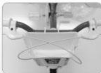
Encaixado no guidão