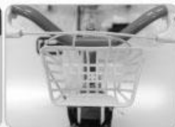
Fixado com abraçadeira de nylon