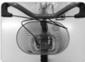
Parafusado no suporte abaixo do guidão