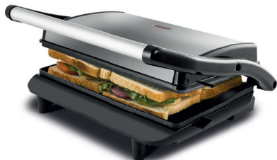
Imagens meramente ilustrativas.