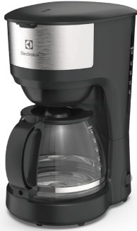
Fotos e desenhos ilustrativos CAFETEIRA_ECM20_PORT_REV00